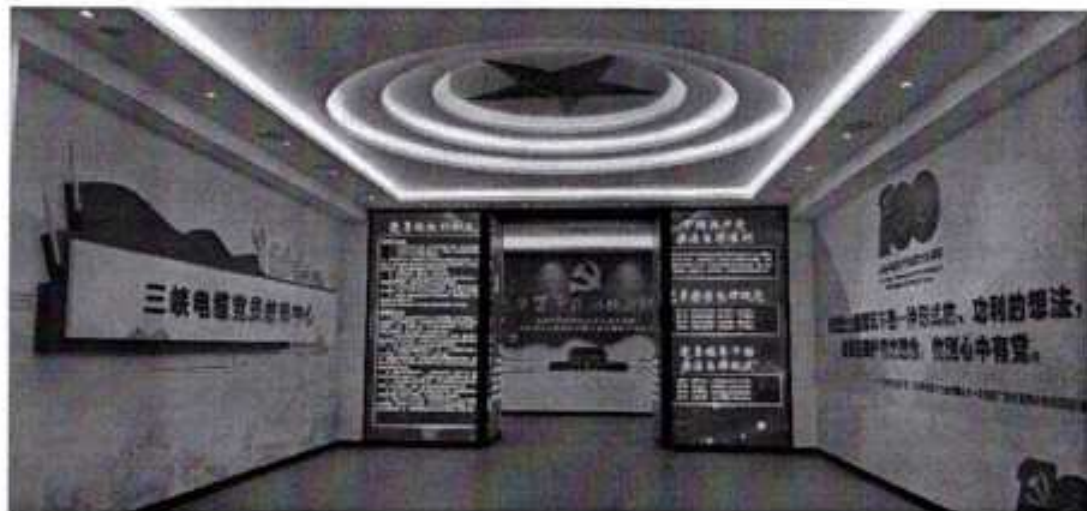
图 3.0 三峡电缆党员教育中心

新时代呼唤新担当，新作为实现新突破。三峡电缆以习近平新时代中国特色社会主义思想为指导，科学把握新发展阶段，坚决贯彻新发展理念，积极促进构建新发展格局，以推动高质量发展为主题、改革创新为根本动力，坚定不移做强做优做大企业，积极履行社会责任，强化使命担当，为夺取全面建设社会主义现代化国家新胜利作出新贡献。