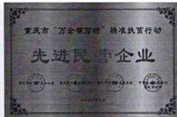
图 2.5 部分荣誉证书