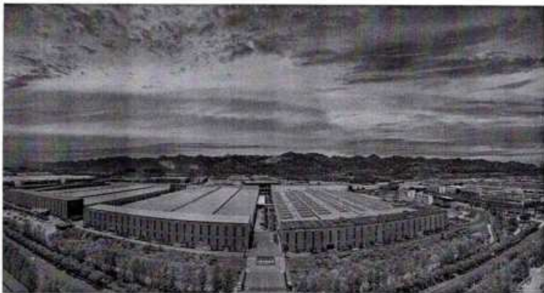
图 2.1 三峡电缆集团全景图